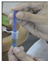
用研磨杆粉碎样品提取蛋白质